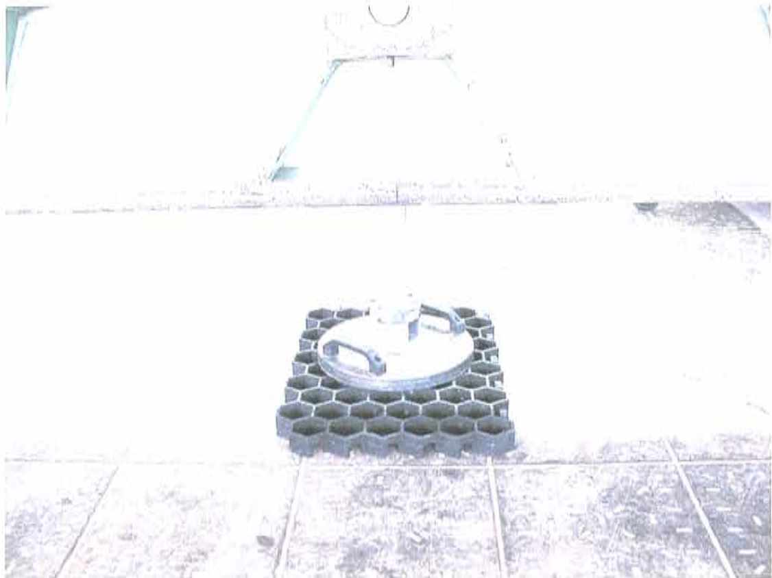
Abbildung 2: Prüfanordnung Rasenwabe / Paddockplatte auf starrem Untergrund

Die Abbildung 2 zeigt die Anordnung des Prüfvorganges der Rasenwabe auf starrem Untergrund. Die Rasenwaben wurden bis zum Eintritt einer plastischen Verformung belastet.