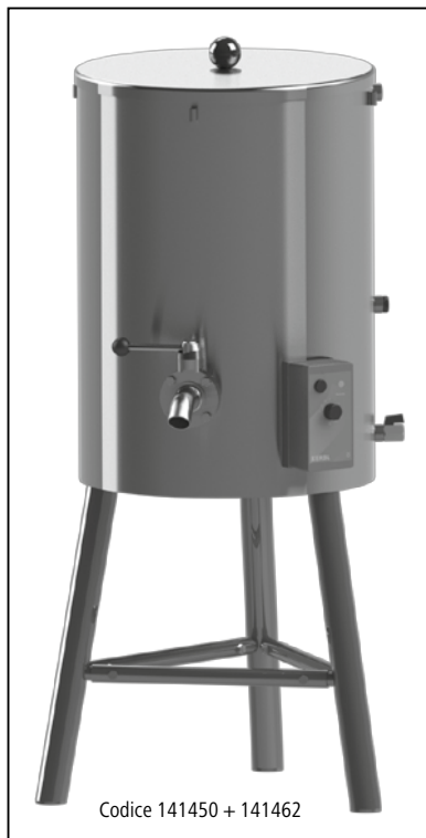
Codice 141450 + 141462